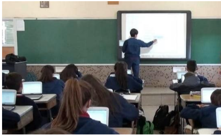
Figura 2. Estudiante utilizando pizarra digital con apoyo de su netbook

trabajo realizado en su netbook, como se observa en la Figura 2, y 2) la practicante utilizaba el E-learning Class para proyectar la pantalla de algún alumno.