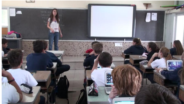
Figura 1. Disposición de mobiliario y elementos del aula de 1° C

al piso y ubicados de modo que todos los estudiantes miraban al pizarrón. Al frente había una tarima donde se encontraba el escritorio del docente con la computadora conectada a un proyector y a la pizarra digital que estaba instalada sobre un pizarrón de tiza como se puede ver en la Figura 1. El aula también contaba con sistema de audio, tomacorrientes en la pared del fondo, acceso a la red local y Wi-Fi.