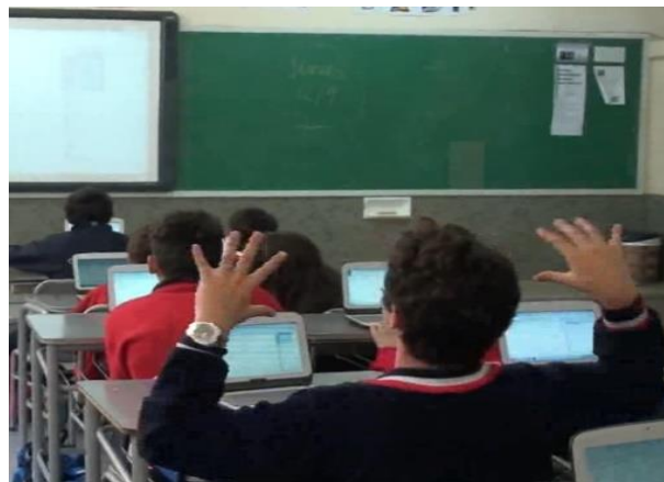
Figura 6. Gesto de un estudiante para indicar que se deben alejar de la Vista Gráfica para ver los puntos

En el segundo evento, que sucedió a la situación anterior, Irina entabla con la clase el diálogo que se incluye en el Anexo 1. Comenzó preguntando a los estudiantes sobre la relación que habían encontrado entre el perímetro y el lado del cuadrado. Los estudiantes habían llegado a la expresión simbólica L \cdot 4 = P , donde L es el lado del cuadrado y P su perímetro. Irina instó a que la introdujeran en la Barra de entrada de GeoGebra para visualizar su gráfico. Los estudiantes la introdujeron y GeoGebra arrojó un mensaje de error. En este momento Irina explicó que el programa solo reconoce como variable independiente a la letra “ x ” y como variable dependiente a la letra “ y ” 14 . Seguidamente preguntó cuáles eran las respectivas variables en este caso, y una vez reconocidas escribieron finalmente en la Barra de entrada x \cdot 4 = y y obtuvieron así el gráfico de la relación.